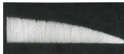
Example of fibers placed in order Esempio di fibre ordinate